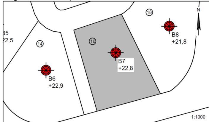
Figur 1 – Situationsplan 1:1000

Filippavej nr.: 16 Boring nr.: B7 Overside bæredygtige lag (OSBL), kote: +22,5 Dybde til OSBL, m: 0,25